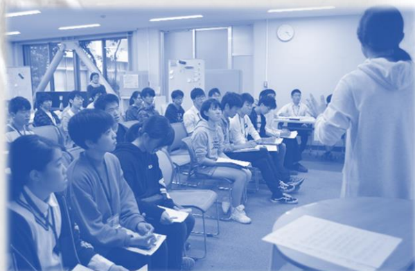
本文と写真は関係ありません